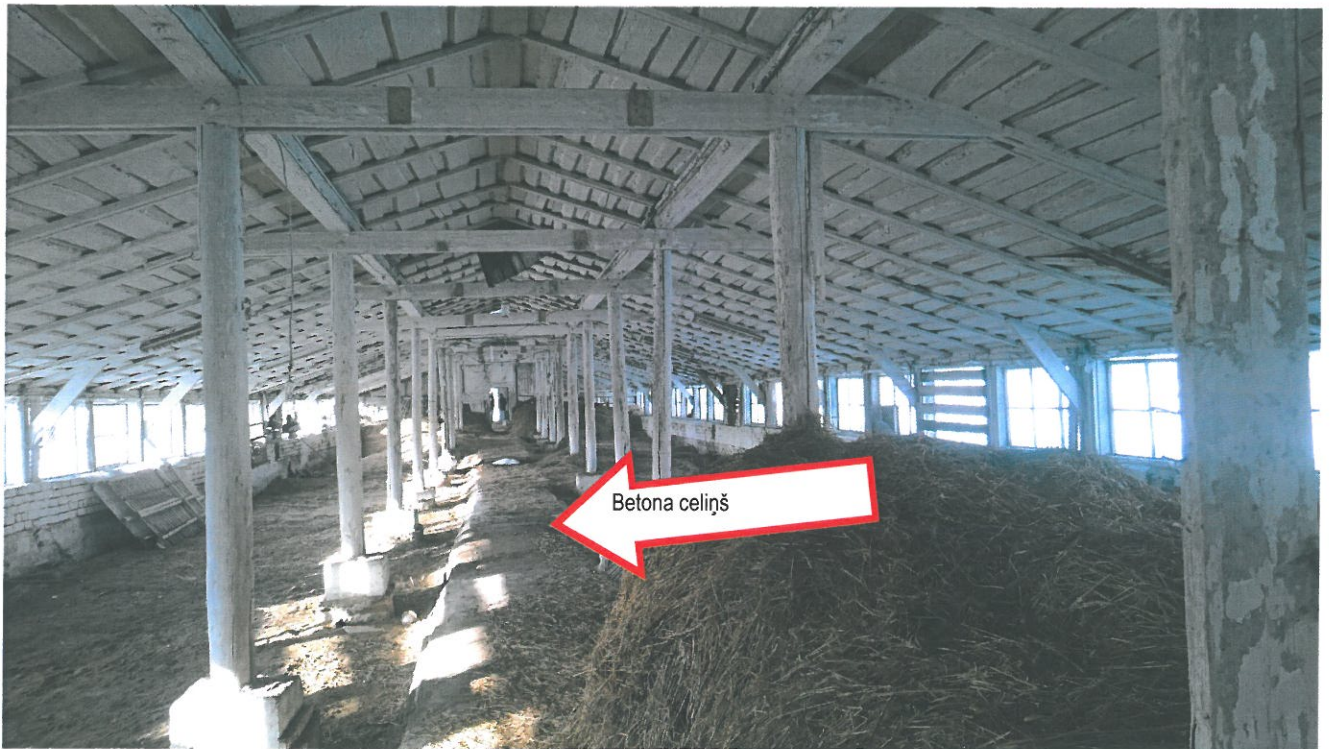
6.attēls. Demontējamas ēkas konstrukcijas.