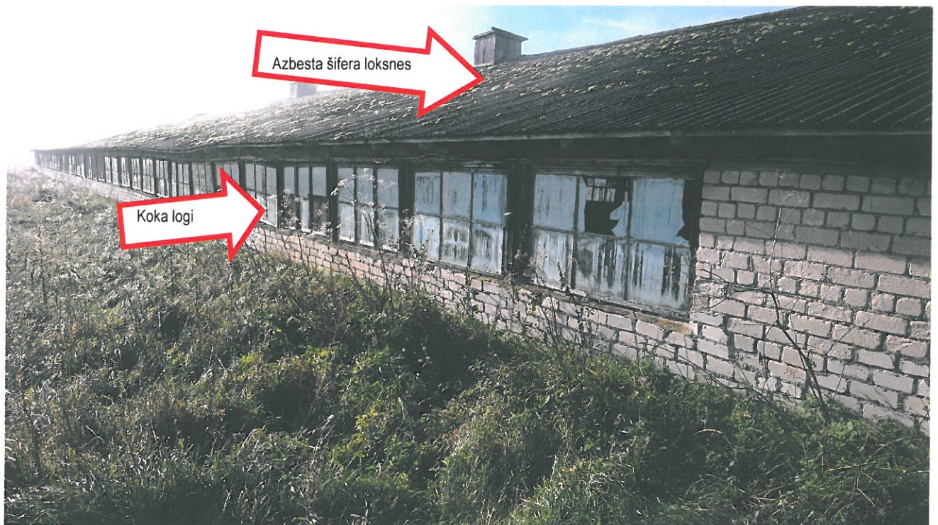
7.attēls. Demontējamas ēkas konstrukcijas.