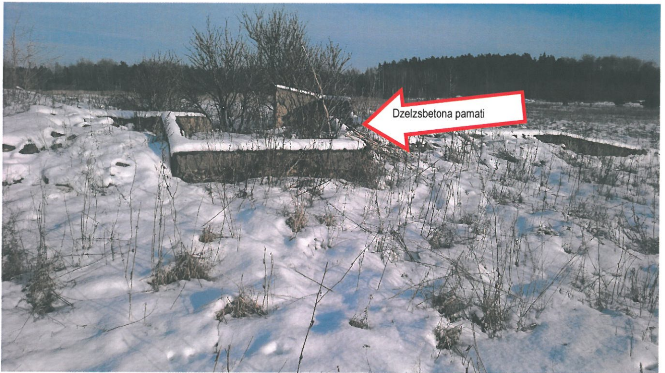
8.attēls. Demontējamas būves pamati.