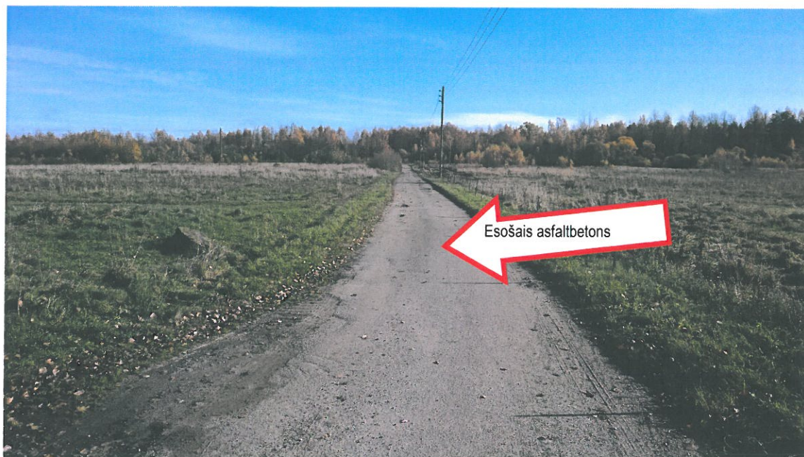
10.attēls. Demontējamais asfaltbetona segums.