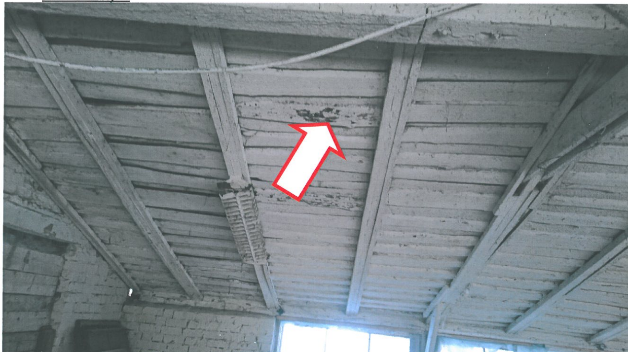
4.attēls. Demontējamas ēkas pārsegums.