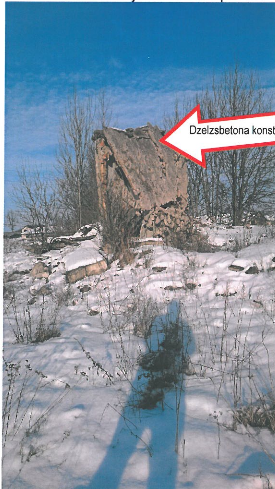
9.attēls. Demontējamas būves konstrukcijas.